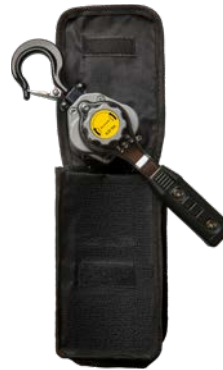
250kg - 500kg